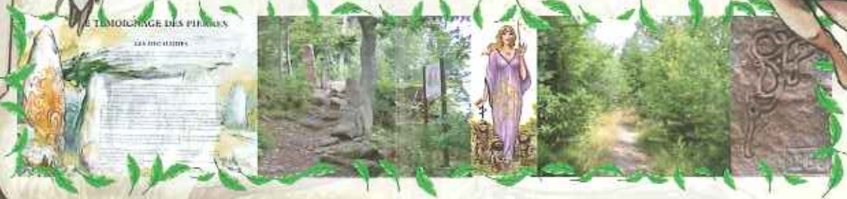
LE TÉMOIGNAGE DES PIERRES DES ENCHANTEMENTS

Parking à proximité de la Chapelle de Laubenheim.